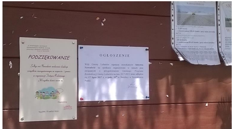
Nowodwór, Nowodwór – Piaski, 17.07.2017, liczba osób 12