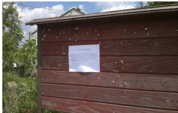
Wola Lisowska, dnia 14.07.2017r., liczba osób: 8