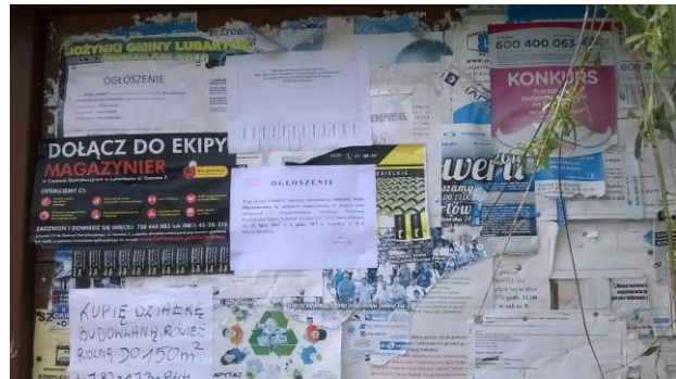
Wola Mieczysławska, dn. 20.07.2017r, liczba uczestników – 20 osób